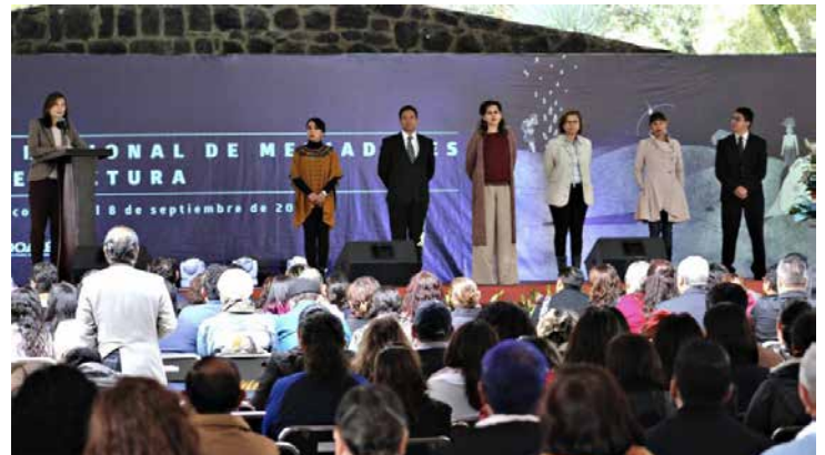
Marina Núñez, al micrófono, inaugura en Encuentro Nacional de Mediadores de Lectura, en Toluca, Estado de México.

Los grandes frutos y el éxito que ha tenido el PNSL a lo largo de dos décadas, ha sido difícil de explicar tanto hacia fuera como hacia dentro del país; sin embargo, Marina Núñez, aseguró que parte de éste radica en la naturaleza de la lectura. “Hay emociones y hay sentimientos que se despiertan en todos alrededor del libro, y hay emociones que decidimos aprovechar para empezar un diálogo con el otro, y el libro nos da ese pretexto”, puntualizó.