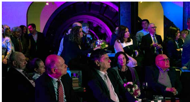
Enrique Krauze, José Luis Echeverría y Carlos Anaya Rosique, entre los muchos invitados.

Finalmente, recordamos que entre los propósitos del Club de Editores están: crear condiciones propicias para fortalecer el espíritu de solidaridad e integración entre los miembros de la cadena productiva del libro; propugnar porque las actividades editoriales tiendan a la dignificación del gremio; fomentar relaciones con asociaciones afines, y llevar a cabo todo tipo de eventos de índole social y cultural orientados a conseguir los objetivos mencionados.