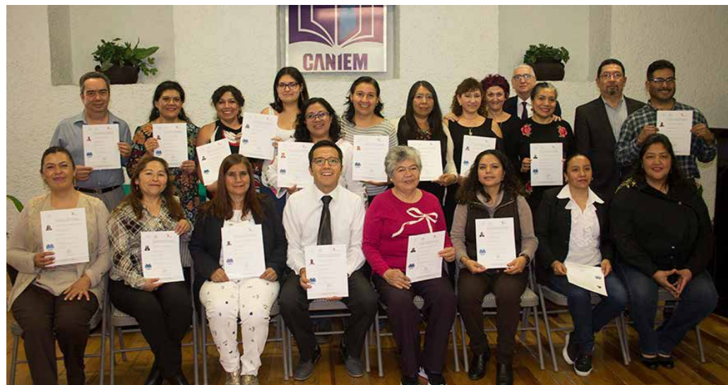
Con orgullo, los nuevos promotores de la lectura muestran su certificado.

Además, mencionó que el encuentro que se dio entre los promotores los va a unir siempre ya que caminaron juntos para dejar la brecha hecha y para que las siguientes generaciones opten por continuar con la certificación.